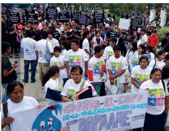
A la izquierda: El diálogo regional “Voces de Dignidad” en Paraguay.