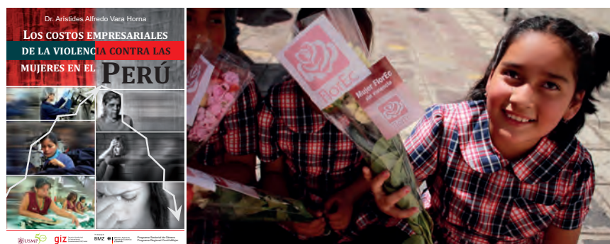
A la izquierda: Estudio “Los costos empresariales de violencia contra mujeres en el Perú”.