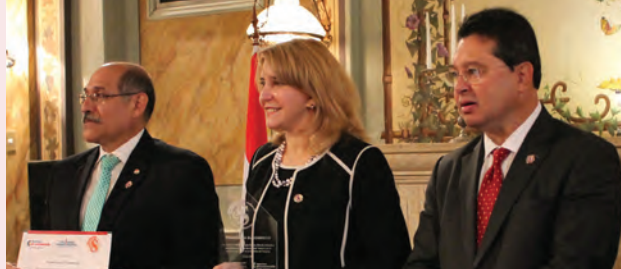
Ministro de trabajo empleo y seguridad social, ministra de la mujer y ministro de industria y comercio durante la entrega del reconocimiento.