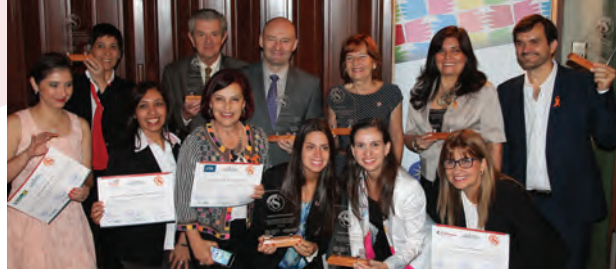
Representantes de las empresas ganadoras del Sello Empresa Segura en Paraguay.