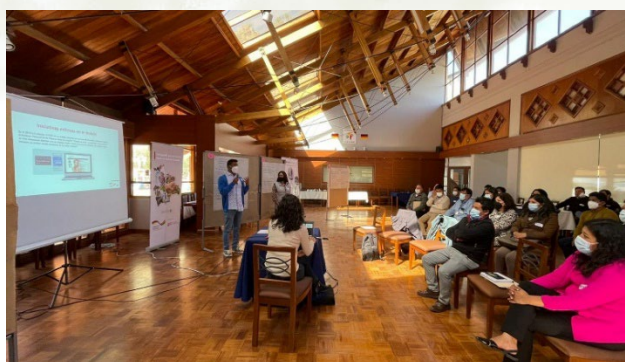
Foto: Taller con niveles de gerencia y jefatura del Servicio de Desarrollo de las Empresas Públicas Productivas (SEDEM), julio de 2022.