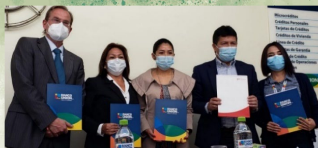
Foto: Firma de Memorándum de Entendimiento entre GIZ-PREVIO, MJyTI y Banco Unión, 8 de julio de 2022.