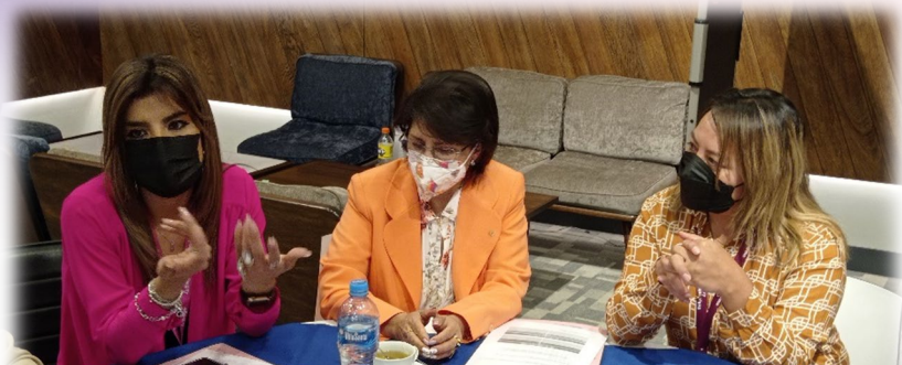
Taller de formación con Laboratorios Bagó en la metodología "Empresa Segura" la gestión 2021.

Varias de las empresas que participaron en este sondeo, posteriormente participaron en el estudio para contar con datos específicos sobre los efectos y costos de la VcM en sus espacios laborales. A partir de esos datos, el proyecto PREVIO brindó asistencia técnica para fortalecer las acciones de prevención y atención de VcM en las empresas.