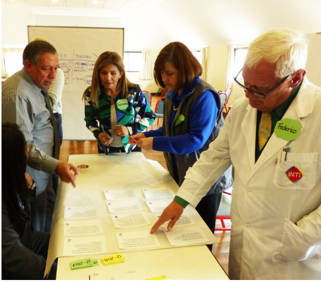
La alta gerencia de Droguería INTI S.A. discute los elementos del modelo de gestión de cero tolerancia frente a la violencia contra las mujeres para la empresa.