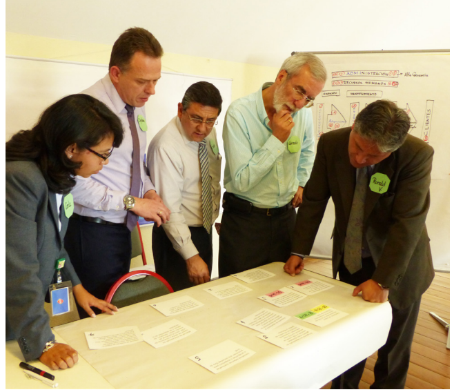
El grupo gerencial de Droguería INTI S.A. analizando la cadena de valor y los diferentes campos donde la violencia podría afectar a la empresa.