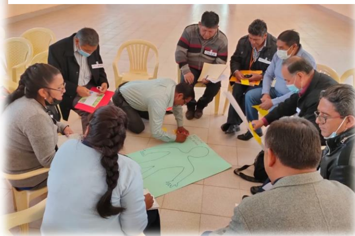
Grupo de maestras*os de en el proceso formativo en Potosí con las metodologías Ruta Participativa y Game Over la gestión 2022.

Estas metodologías son parte del proyecto Prevención de la violencia contra las mujeres – PREVIO de la Cooperación Alemana implementada en Bolivia por la GIZ.