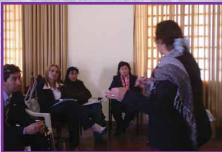
Exitoso inicio de la campaña ANA

versidad Nacional de Pilar y representantes y corresponsales de la prensa oral y escrita.