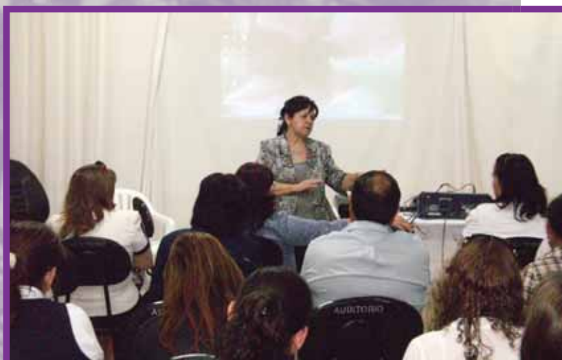
En el seno de la Asociación de Intendentes/as del Dpto. de Itapúa y en el Centro Regional de Educación se presenta la Campaña ANA.