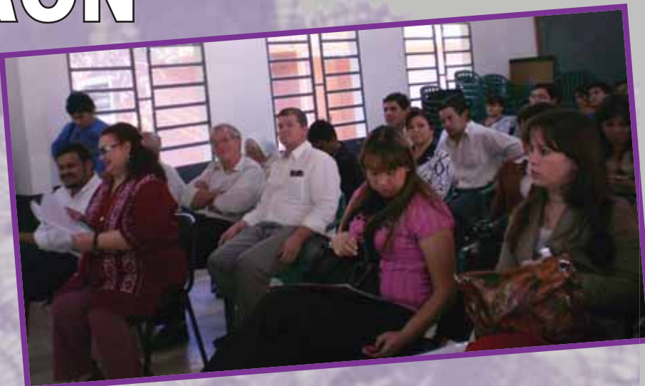
Con presencia de la Sra. Ministra e importantes autoridades departamentales se lanzo la Campaña ANA

Ministra de la Mujer de la Presidencia de la República, Asesora Técnica de la SMPR, Directora de la Dirección de Igualdad de Oportunidades/SMPR, Técnica del Ambito de Mujer Indígena de la SMPR, Directora General de Educación Media del MEC, Jefa del Departamento de Información de la Educación Media del MEC, Coordinadora Departamental de Supervisiones Educativa de Boquerón, Supervisoras/es de Gestión Técnico Pedagógico y Administrativo, Técnicas de las Supervisiones, Directoras y Directores de Colegios Nacionales, Privados y privados Subvencionados; Concejala Departamental de Boquerón, Secretaria de la Mujer de las Municipalidades de Filadelfia y Loma Plata, responsables de las Consejería Municipales por los derechos del niño, niña y el adolescente (CODENI) de Filadelfia, estudiantes del 3° año de la Educación Media de Filadelfia, representantes y corresponsales de la prensa oral y escrita. (Diario ABC color, TV40)