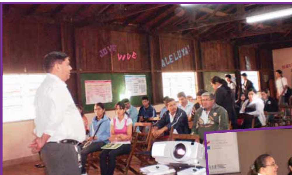
En el Centro Educativo del Mbarakayú y la Escuela Agrícola de Curuguaty se debatió el tema de la violencia en el marco de la Campaña ANA.