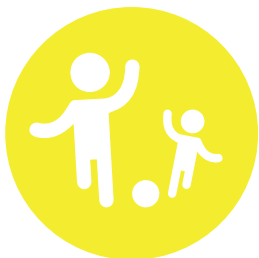
Tiempo ocio con hijos/hijas