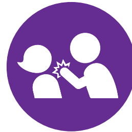
Violencia contra las mujeres