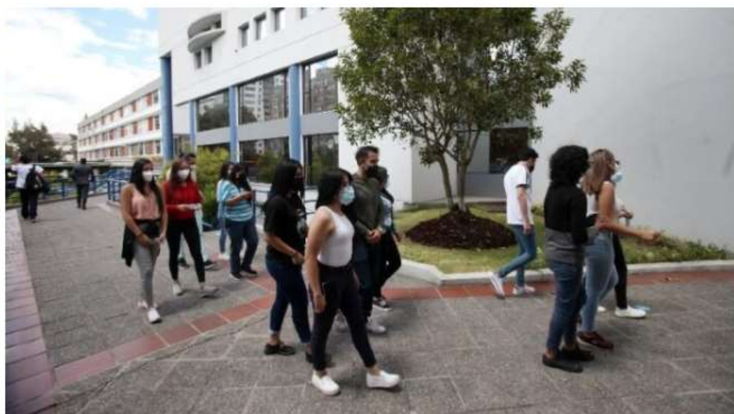
Imagen referencial. El estudio se realizó con 16 universidades públicas y privadas de todo el país.