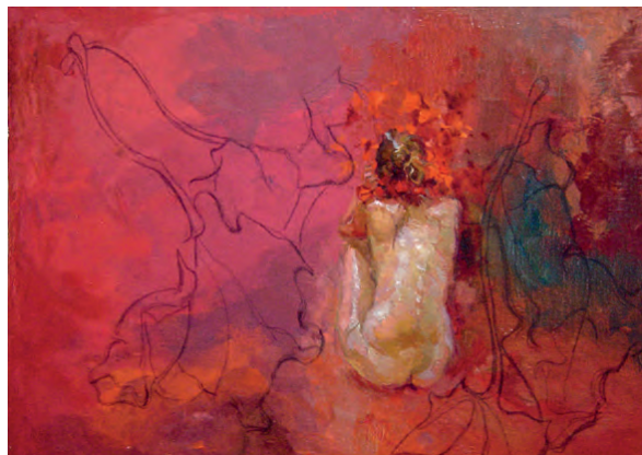
De Ramón Gutiérrez , autorizada por CC BY-SA 2.0

Un producto regional particularmente relevante fue el reportaje " Muertes anunciadas – Feminicidios en América Latina ", elaborado por la Deutsche Welle en alianza con ComVoMujer y difundido por este canal alemán en cuatro idiomas, a nivel mundial, durante varios años (ver página 5).