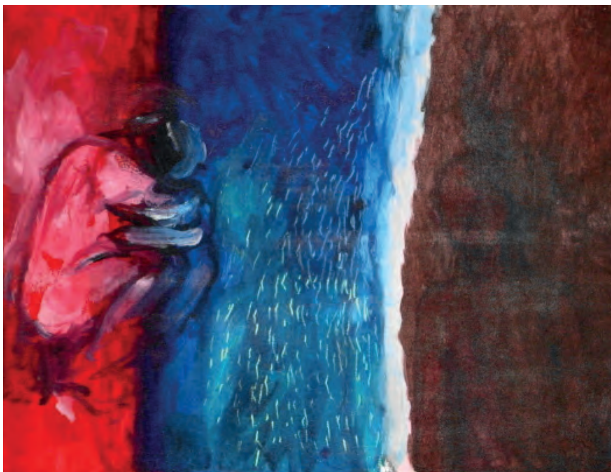
“Without the flower”, pintura final de la serie de flores, de Lohan Gunaweera , autorizada por CC BY-SA 2.0