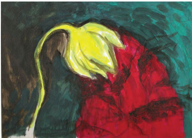
"Flower 1", Acrylic on Paper, 2003 by Lohan Gunaweera is licensed under CC BY-SA 2.0