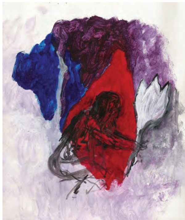
"Flower 2", Acrylic on Paper, 2004 by Lohan Gunaweera is licensed under CC BY-SA 2.0