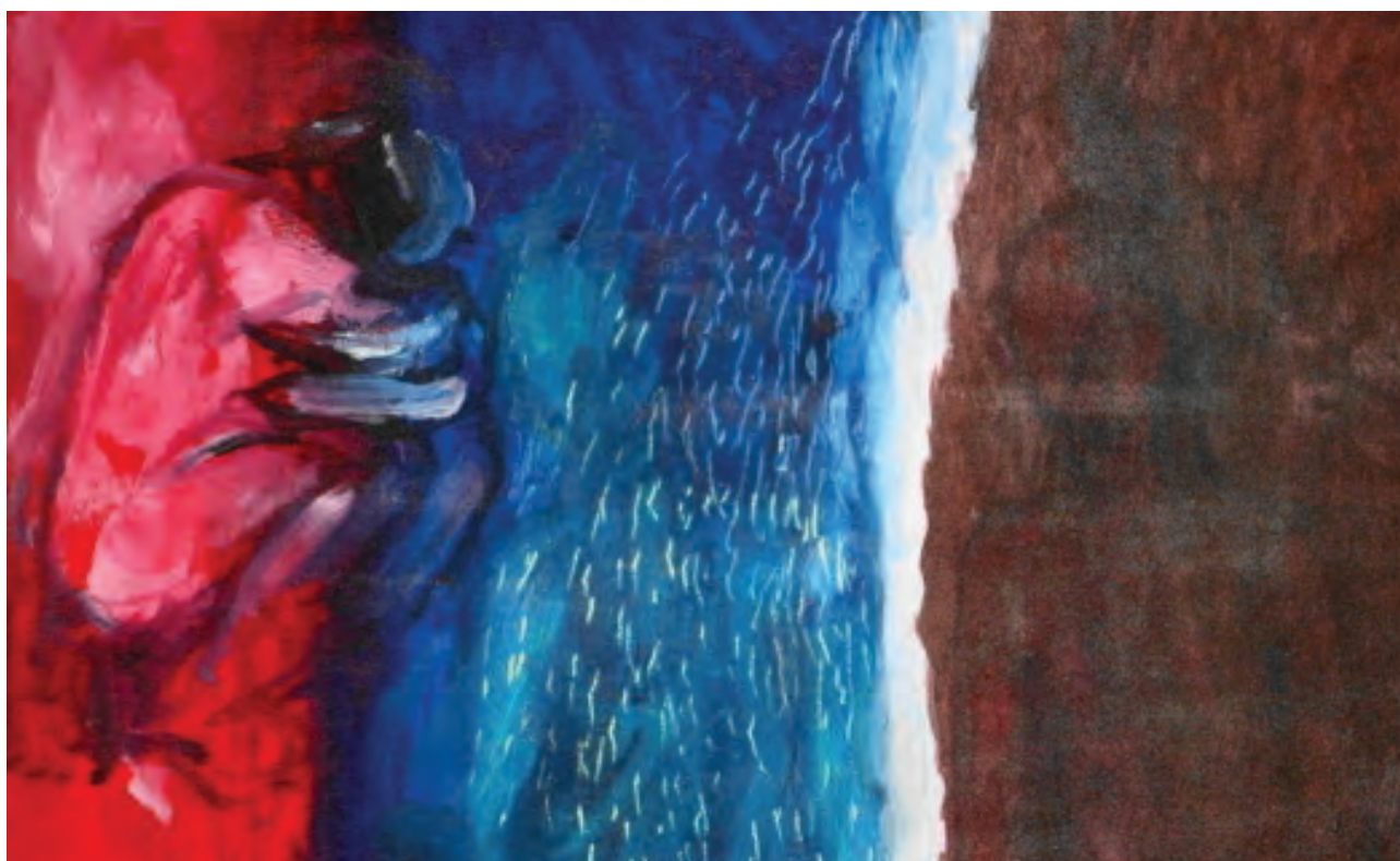
"Without the flower", Final painting of Flower series by Lohan Gunaweera is licensed under CC BY-SA 2.0

La naturalización y normalización de la violencia contra las mujeres y la falta de acceso a la justicia, junto con lo mencionado anteriormente, son los principales factores para que las intenciones de los victimarios concluyan en feminicidios 7 .