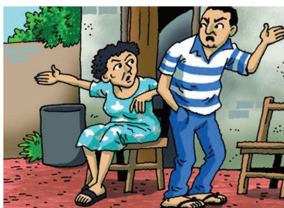
FASE DE TENSIÓN

¿POR QUÉ LOS CASOS DE VIOLENCIA CONTRA LAS MUJERES SE REPITEN?