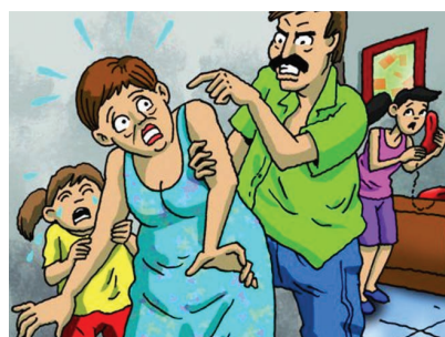
FASE DE AGRESIÓN