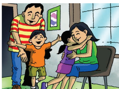
FASE DE RECONCILIACIÓN