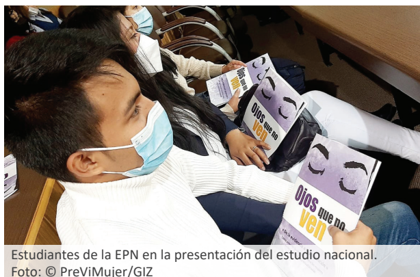
Estudiantes de la EPN en la presentación del estudio nacional.