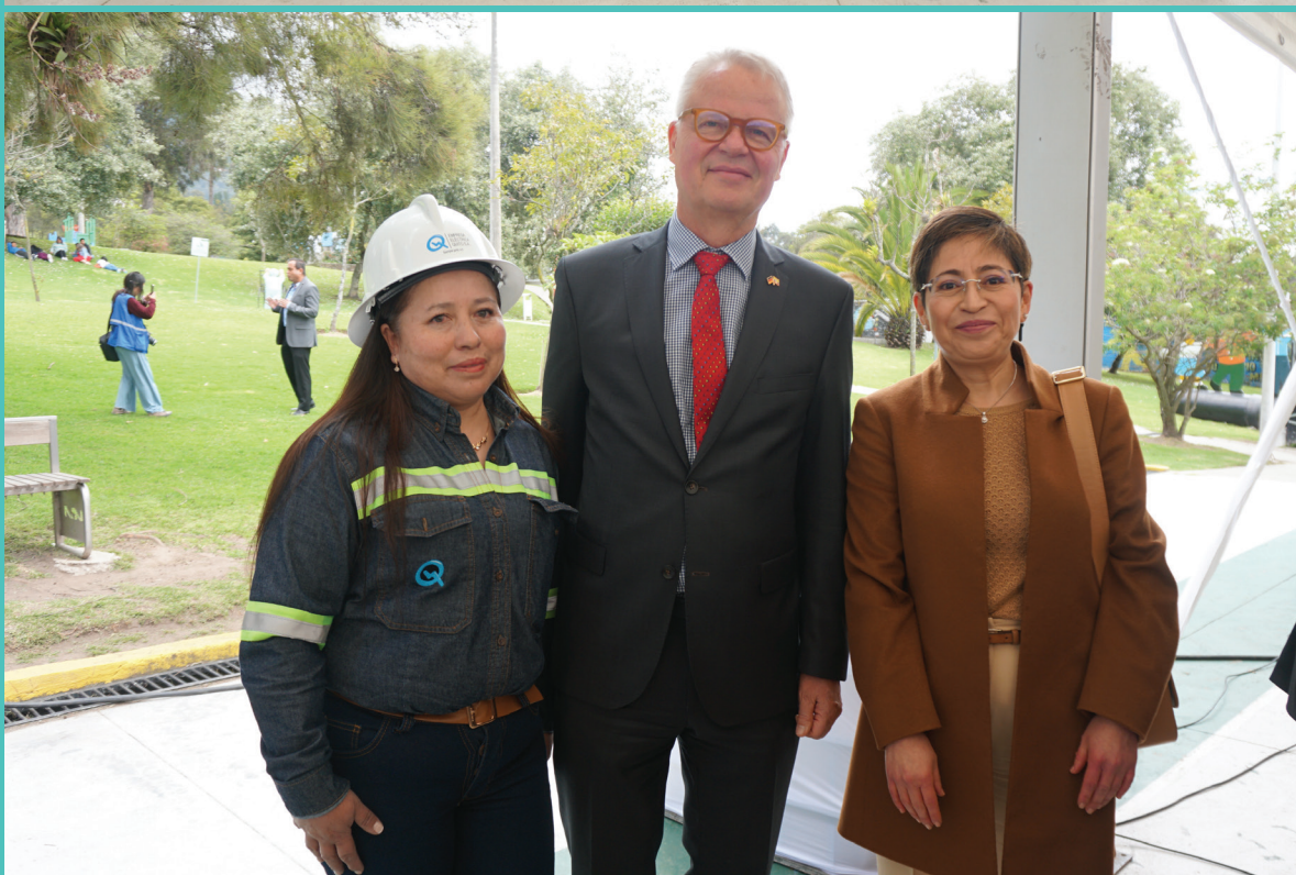
Entrega de las placas de Instituciones Seguras, realizado el 14 de marzo de 2024, en el Parque de la Mujer, con la presencia de la Ministra del Interior, Ministra de Trabajo y el Embajador de Alemania, como las principales autoridades.