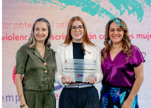
La Ministra de la Mujer y Derechos Humanos, Arianna Tanca (mitad), entregando el Sello Empresa Segura en el mismo evento, en el marco del 25 de noviembre, Día Internacional contra la Violencia hacia la mujer, 2024.