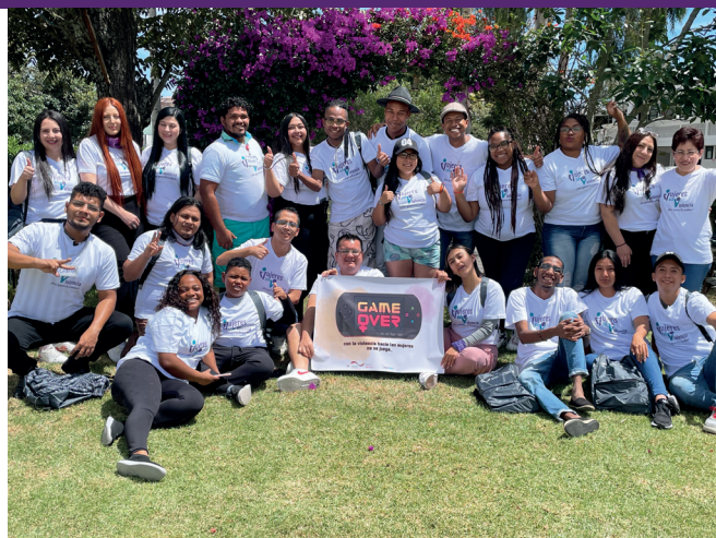
Multiplicador*s de la metodología Game Over: con la violencia hacia las mujeres no se juega que se formaron a nivel nacional.

65 de cada 100 mujeres en Ecuador se ven afectadas por la violencia de género