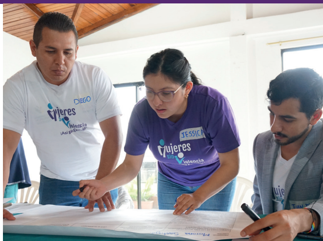
Participantes de un taller de la Red de Mujeres Amazónicas analizan conjuntamente las disposiciones legales para prevenir la VcM.