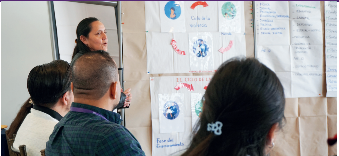
Servidor* s públic* s del Ministerio de Gobierno fortalecen sus capacidades para prevenir la violencia contra las mujeres.