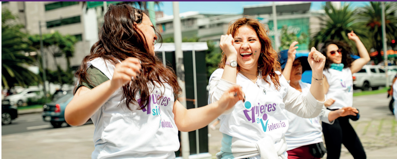
Teilnehmerinnen der Kampagne Mujeres sin Violencia: ¡Así gana Ecuador! („Frauen ohne Gewalt: So gewinnt Ecuador!“), die von der Ombudsstelle und der Stadtverwaltung von Quito ins Leben gerufen wurde.

Darüber hinaus stärkt das Projekt den Erfahrungsaustausch zwischen staatlichen und nichtstaatlichen Akteur*innen, unterstützt sie bei der Weiterentwicklung ihrer Kompetenzen, vermittelt Wissen und fördert Kampagnen sowie systemische Managementmodelle für Universitäten und Bildungseinrichtungen. Ziel ist es, ihnen die Umsetzung abgestimmter, koordinierter, innovativer und nachhaltiger Maßnahmen zur Prävention von Gewalt gegen Frauen zu ermöglichen.