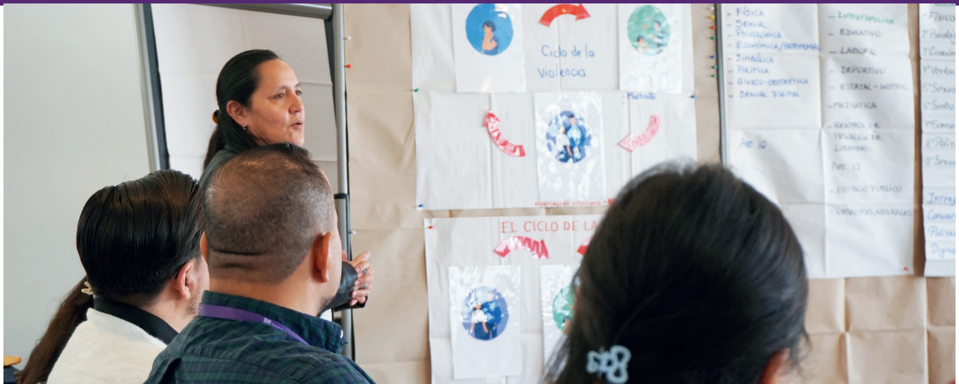
Beamte*innen des Regierungsministeriums bauen ihre Kompetenzen zur Prävention von Gewalt gegen Frauen aus.