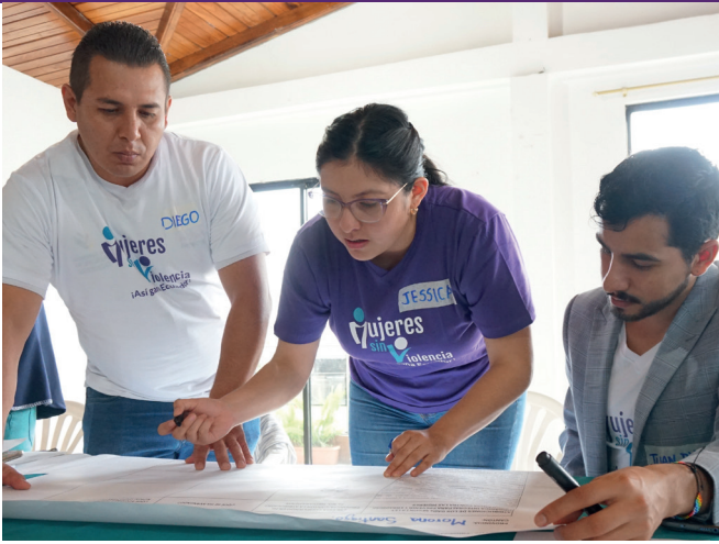
Die Teilnehmer*innen eines Workshops des Netzwerks der Amazonas-Frauen setzen sich gemeinsam mit den gesetzlichen Vorgaben zur Prävention von Gewalt gegen Frauen auseinander.