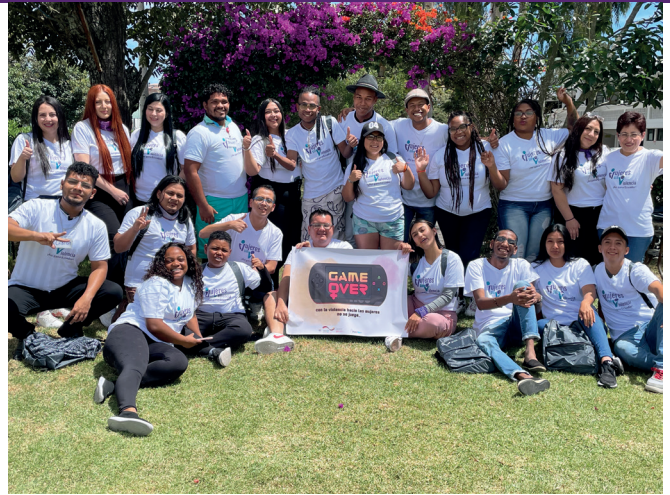
Multiplikatoren*innen der Methode „Game Over: mit Gewalt gegen Frauen spielt man nicht“ wurden auf nationaler Ebene ausgebildet.